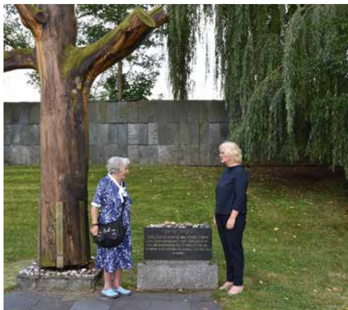
U památného stromu v Terezíně s bývalou německou ministryní obrany Christine Lambrechtovou.

(KKL) kibuc. Opravdu se jim ho na vyprahlém kamenitém kopci, pod nímž museli vysušit bažiny, podařilo postavit. Otec však při tom onemocněl malárií a vrátil se v roce 1930 do Prahy, aby se vyléčil a také oženil.