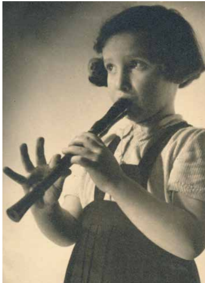
S dřevěnou flétničkou, dárkem k osmým narozeninám, které „slavila“ v terezínském ghettu.